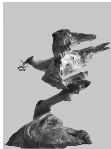
"La colomba della pace"

Ha veramente ragione Cecilia Strada a rilevare la continuità storica della questione migratoria. È un problema, non eluso dalla nostra quotidianità, che ha i risvolti della tragedia. Pertanto "non può essere gestito sull'onda delle emozioni", bensì con una politica europea, meglio se mondiale, dell'accoglienza. Mi rendo conto che non è facile offrire prospettive ottimistiche sull'avvenire di chi, suo malgrado, deve subire la condizione di profugo, ma rispondere con muri e filo spinato è davvero disumano e ripugnante.